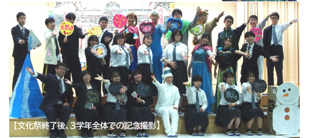
【文化祭終了後、3学年全体での記念撮影】